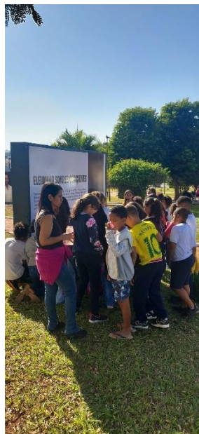
Alunos diante de um dos totens Data: 25/06/2024