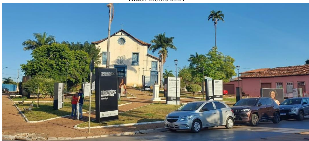
Exposição Muros Invisíveis na Praça da Matriz de Paracatu Autoria: Maria Letícia Ticle Data: 25/06/2024