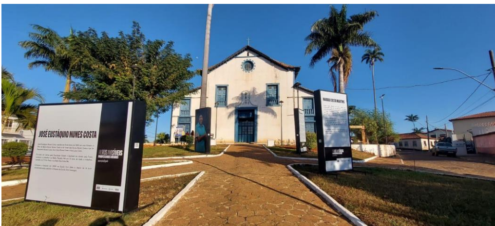
Exposição Muros Invisíveis na Praça da Matriz de Paracatu Data: 25/06/2024