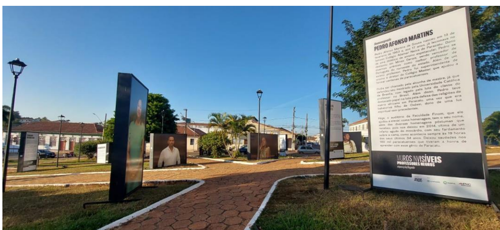
Totens da exposição distribuídos na praça Autoria: Maria Leticia Ticle Data: 25/06/2024

O objetivo da visita foi o acompanhamento de uma dessas visitas, realizada com cerca de 50 alunos do Centro Municipal Educacional Coraci Meireles de Oliveira e algumas professoras, entre 7h30 e 9h30. Para a realização desta e das demais visitas do projeto, foi contratada uma agência de turismo de Paracatu. Estiveram presentes os guias da agência, além de duas produtoras do projeto; os alunos foram recebidos e foi dada uma explicação sobre a exposição. Em seguida, foram divididos em dois grupos, que percorreram todos os totens, observando as fotografias e lendo os textos. Os guias faziam algumas provocações e auxiliavam na compreensão dos textos. Ao final, os grupos se reuniram e foi finalizada a visita.