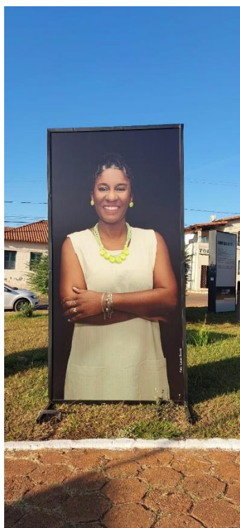
Toten da exposição com fotografia de uma das professoras Autoria: Maria 25/06/2024