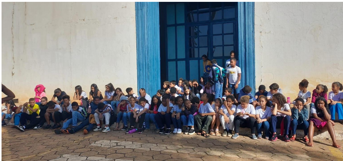
Alunos que participaram da visita Data: 25/06/2024

Após a visita, a equipe do Semente se reuniu com as produtoras do projeto para elucidar questões adicionais relativas ao projeto, tais como a conferência da equipe contratada, as atividades já executadas – ciclos de debates e respectiva divulgação das gravações, produção de peças gráficas, local de guarda dos totens, os critérios utilizados da curadoria.