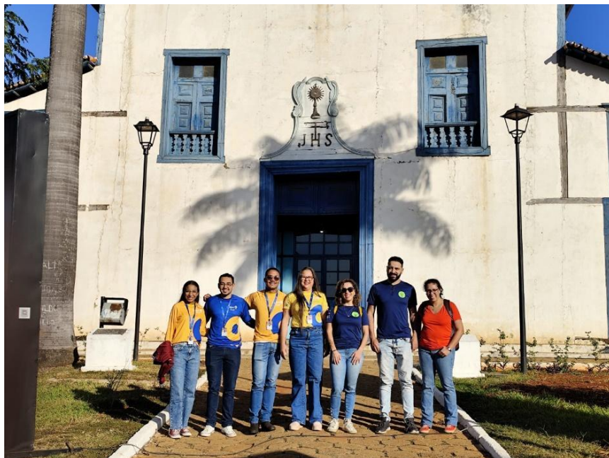
Equipes do Semente, Sempre um Papo e da agência de turismo Data: 25/06/2024

Ao final da visita, constatamos que o projeto está em andamento e que as atividades estão sendo executadas e satisfatoriamente recebidas pelos participantes.