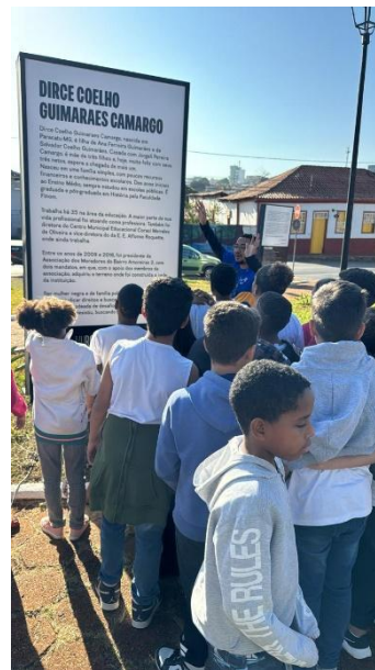
Alunos durante a visita Data: 25/06/2024